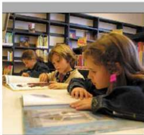
PICCOLI LETTORI Al via l'ottava edizione di "Libro che gira, libro che leggi"